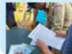
安全運転自己診断の 実施状況

・C/P機関 :公共事業運輸省、保健省等 ・経済成長が見込まれる中、国道5号線をはじめとする幹線道路における道路交通安全に関する対策を実施。