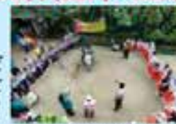
学校での安全教育

・C/P機関 :ダッカ首都警察 ・交通安全教育・交通安全事故収集に係る支援やパイロット事業などを行い、これら一連の活動を通じてダッカ首都警察の道路交通安全対策能力向上を実施。