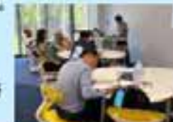
来日による研 修状況

2018年~2020年:交通警察行政研修。2019年~交通安全研修。計33か国より80名を超える短期研修員を受入。我が国の交通戦争の経験そして2000年代以降の取り組みを学ぶことを通じ、交通安全対策にかかる講義・視察を網羅的に提供。