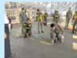
警察への事故捜査 トレーニング

・自動車交通量の増加によって交通事故が多発しており、交通事故死者数の多さは、世界的に見ても上位。交通安全事故分析を実施し、事故多発地域の改善を支援。