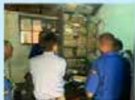
警察ステーション 執務室内の様子 (現状)

・C/P機関 :ケニア国家警察、国道公社等 ・歩行者の交通事故死者数が多いのが特徴。 エビデンスベースの取締り計画・取締り技術の移転、他ステークホルダーを巻き込んだ交通安全対策を実施。