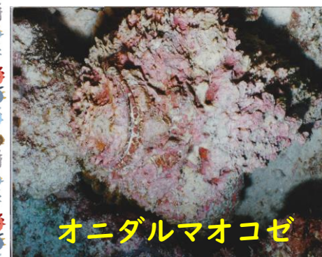
オニダルマオコゼ